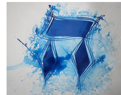
Calligraphie Michel D'Anastasio